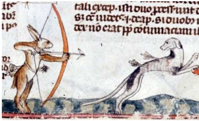
◀ Liebre cazando un perro. Decretales de Gregorio IX, 1330-1340, sur de Francia, pintura sobre pergamino. Londres, British Library, Ms. Royal 10 E IV.

http://2.bp.blogspot.com/_yAdUICQZuA4/TGgc8HCnwtI/AAAAAAAAABj8/H1474P9WnVg/s320/royal10eiv_takedown.PNG [captura 31/05/2011]