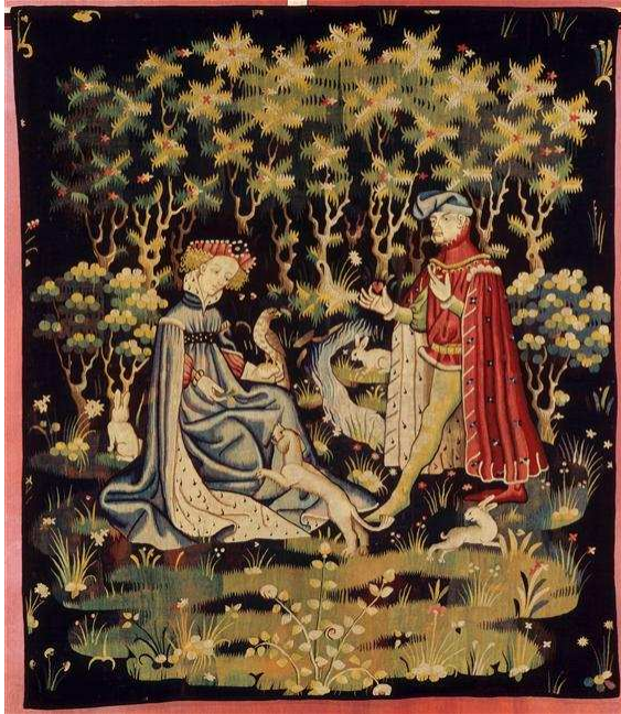
La ofrenda del corazón, comienzos del siglo XV, Arras (Francia), tapicería de lana. París, Musée national du Moyen Âge – Thermes & Hôtel de Cluny.