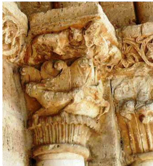
Capitel con perro persiguiendo a una liebre, iglesia de San Juan ante Portam Latinam, Arroyo de la Encomienda, Valladolid (España), siglo XII, piedra.