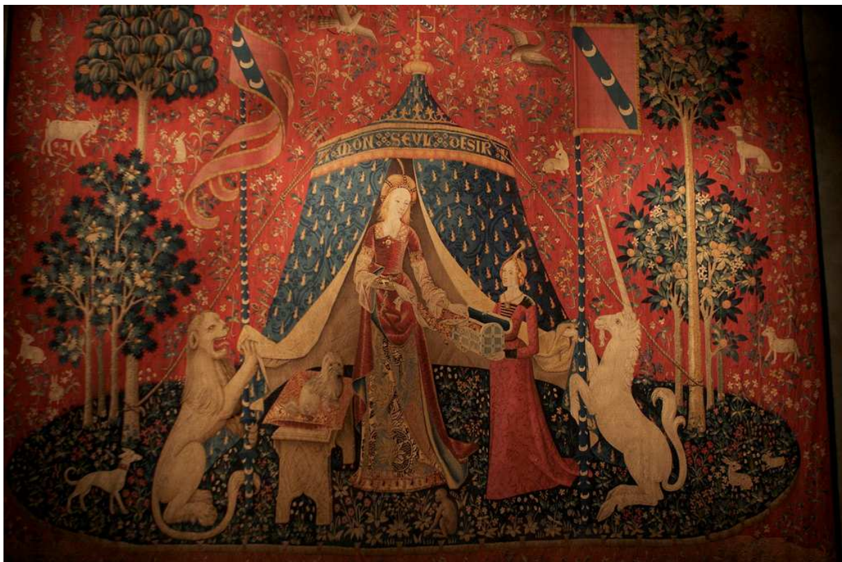
À mon seul désir, ca. 1500, ¿Bruselas?, serie de La dama y el unicornio , tapicería de lana. París, Musée national du Moyen Âge – Thermes & Hôtel de Cluny.

http://es.m.wikipedia.org/wiki/Archivo:CapitelE18.JPG [captura 31/05/2011]