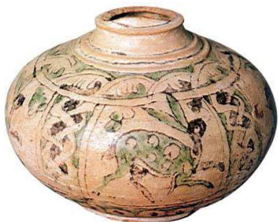
Redoma de las liebres, siglos X-XI, cerámica vidriada verde y manganeso. Córdoba (España), Museo Arqueológico.

http://www.artehistoria.jcyl.es/tesoros/obras/30799.htm [captura 31/05/2011]