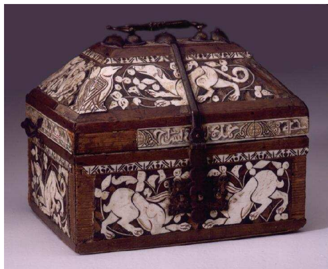
◀ Arqueta de las liebres, siglo XII, madera de ébano y marfil. Madrid (España), Museo Arqueológico Nacional.

http://www.viajarcastillayleon.net16.net/image/leonisidoro13.jpg [captura 31/05/2011]