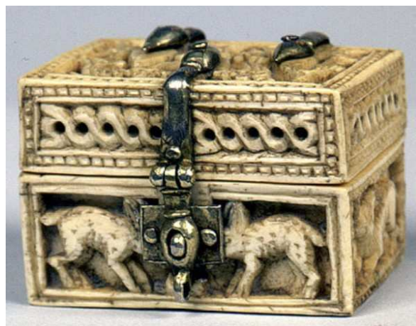
Arqueta de las liebres, siglo XI, marfil. Tesoro de San Isidoro de León (España).

http://www.artehistoria.jcyl.es/tesoros/obras/30799.htm [captura 31/05/2011]