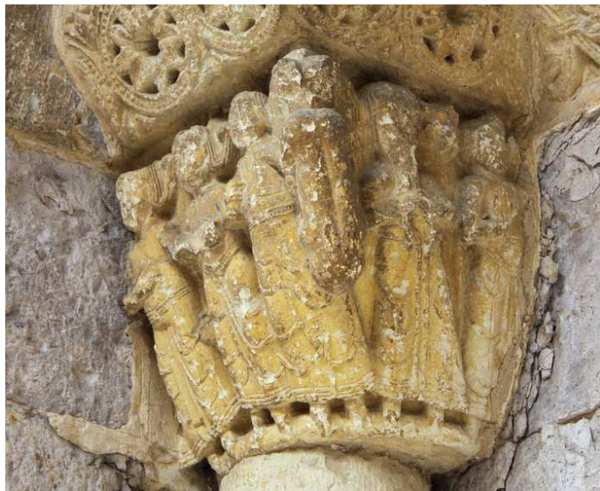
Capitel con liebre, jamba izquierda de la portada meridional de la iglesia de Santa María del Camino, Carrion de los Condes, Palencia (España), ca. 1130, piedra.