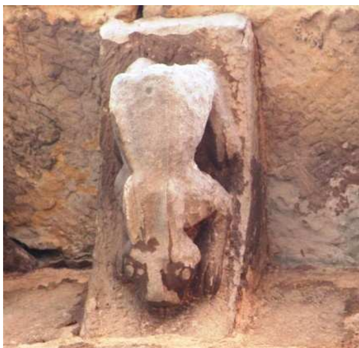
Canecillo con liebre, Colegiata de San Pedro de Cervatos, Cantabria (España), primera mitad siglo XII.