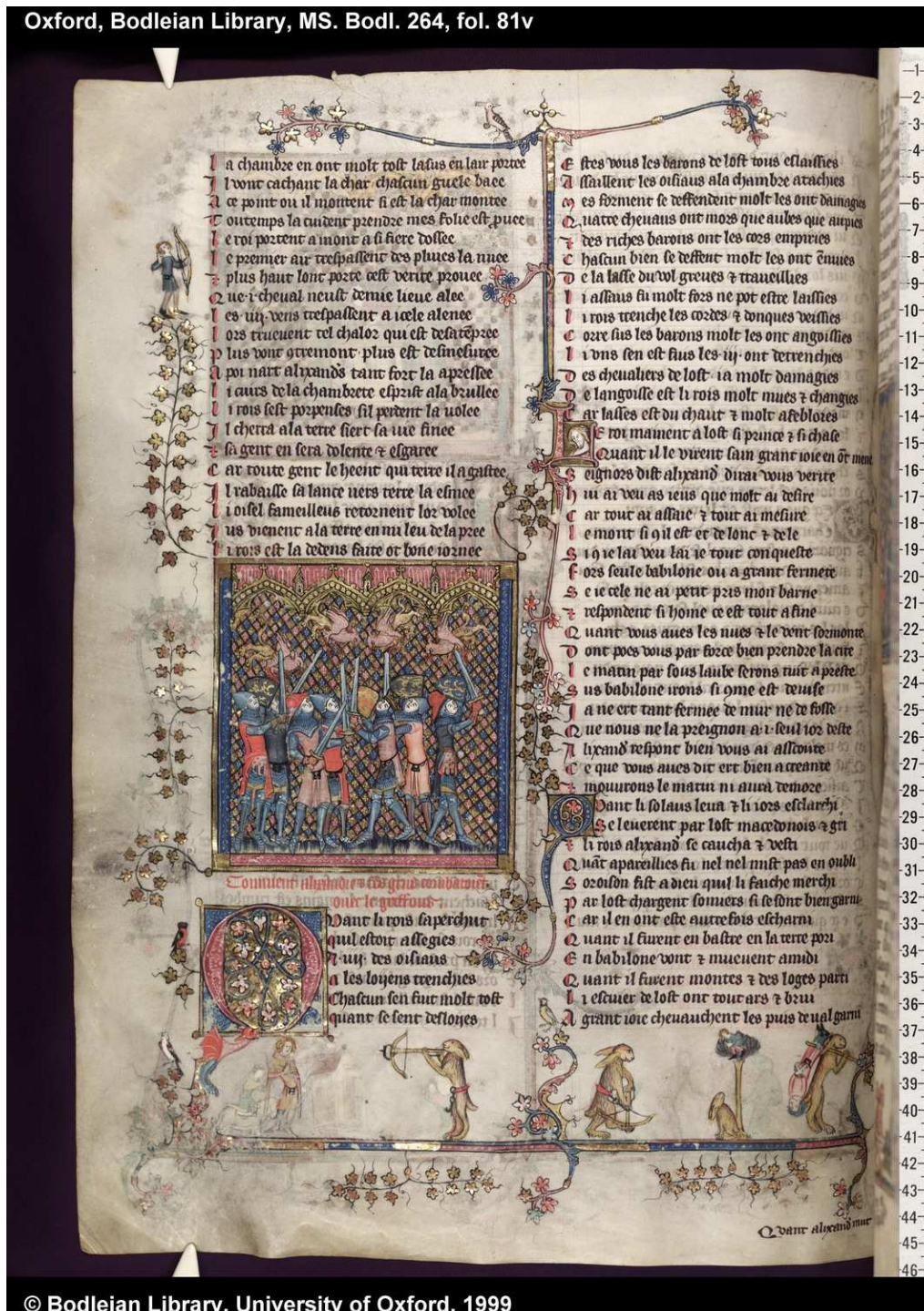
Oxford, Bodleian Library, MS. Bodl. 264, fol. 81v

http://image.ox.ac.uk/images/bodleian/ms.bodl.264/81v.jpg [captura 31/05/2011]